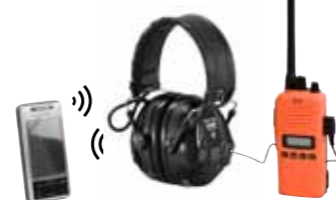
Flera anslutningsmöjligheter – trådlöst och via kabel.

Telefonsamtal hanteras också trådlöst via Bluetooth. Ringsignalen hörs i headsetet och med ett enkelt tryck på Bluetooth-knappen på den vänstra kåpan väljer du att svara eller avvisa samtalet. Ringer det samtidigt som du lyssnar på musik, stängs musiken av och när du avslutar samtalet fortsätter musiken automatiskt.