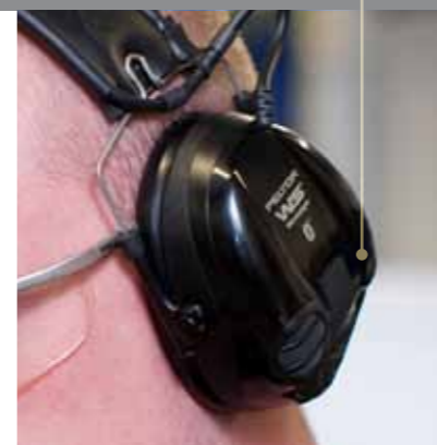
Bluetooth™ möjliggör trådlös kommunikation. Med den välplacerade svarsknappen på vänster kåpa kan du enkelt ta emot och avvisa samtal på mobiltelefonen.

Det är normalt mycket svårt att föra telefonsamtal eller samtal i kommunikationsradio när du befinner dig i bullriga miljöer. Den du pratar med hör ofta mer buller än din röst. För att göra det möjligt att skilja buller från tal används traditionellt bullerkompenserade bommikrofoner som monteras på en mikrofonarm och placeras nära munnen. WS Workstyle använder en annan teknik och är i standardutförande utrustad med nyutvecklade inbyggda mikrofoner som med avancerade DSP-algoritmer elektroniskt filtrerar bort buller utan någon bommikrofon. De inbyggda mikrofonerna fungerar bra i miljöer med bullernivåer upp till 85 dB. Vistas du i högre bullernivåer finns även möjligheten att ansluta en traditionell bommikrofon till WS Workstyle.