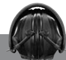
Hopfällbar. För enklare förvaring.

Mikrofon för medhörning Talmikrofon Bluetooth™-aktivering